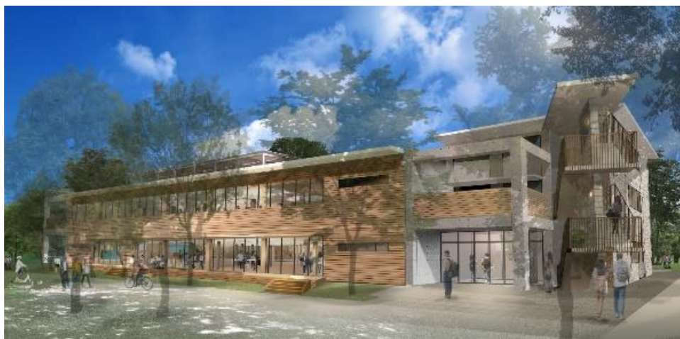
本拠点完成予想図

本拠点は、東京多摩（西東京）地域が国際的に注目されるよう、この地域にある知的価値を集め、グローバルな産業へと展開する拠点となることを目指しています。「農」と「食」、そして「エネルギー」に焦点を当て、西東京地域の皆様と新しい未来を共創する拠点にしていきます。